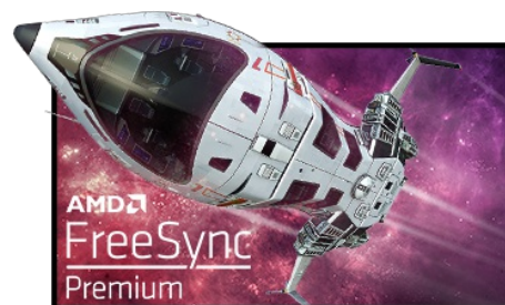
FreeSync™ Premium Technologie

Die Fast IPS Technologie garantiert nicht nur lebendige Schlachtfeldszenen mit hoher Farbtreue, sondern auch eine ultraschnelle Reaktionszeit von nur 0.8ms (MPRT) für bewegte Bilder.